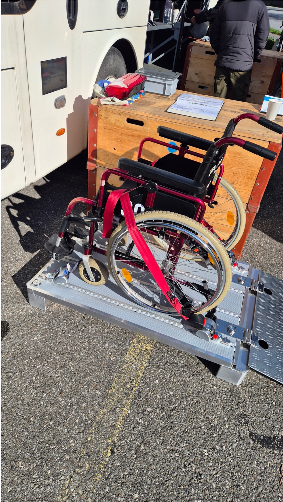
Arrimage 4 points selon la LHand (loi transport handicap)